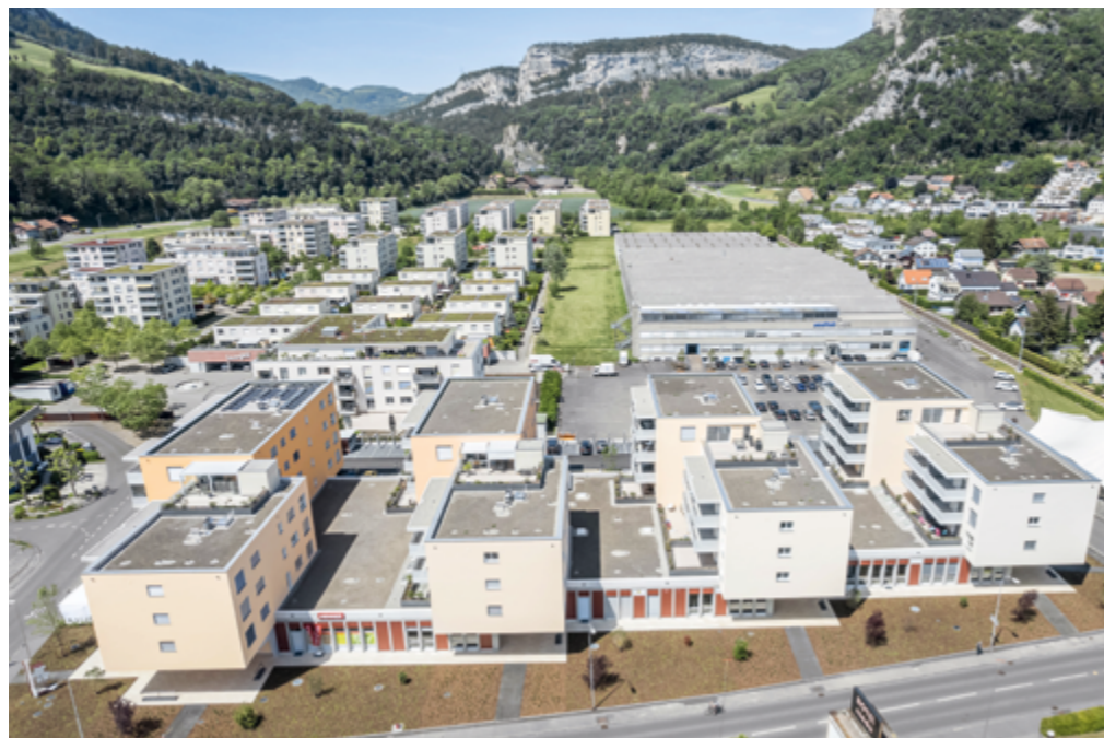
Vielfältige Infrastruktur: im Leuenfeld kommen Jung und Alt auf ihre Kosten.

Seit dem Jahr 2008 hat Schmid in mehreren Etappen den Wohnpark Leuenfeld in Oensingen (SO) realisiert. Ein lebendiges, modernes und nachbarschaftliches Mehrgenerationenprojekt mit 364 Wohneinheiten an zentraler Lage mit einem eigenen Kindergarten, einer Kindertagesstätte, einem Quartierraum und Aufenthaltsplätzen für Jung und Alt. Das Herz des Wohnparks ist die grosszügige Natur- und Freizeitanlage mit eigenem Schwimmteich und Badehaus. Zu den Doppel- und Reiheneinfamilienhäusern gesellen sich Eigentums- und Mietwohnungen in Mehrfamilienhäusern.